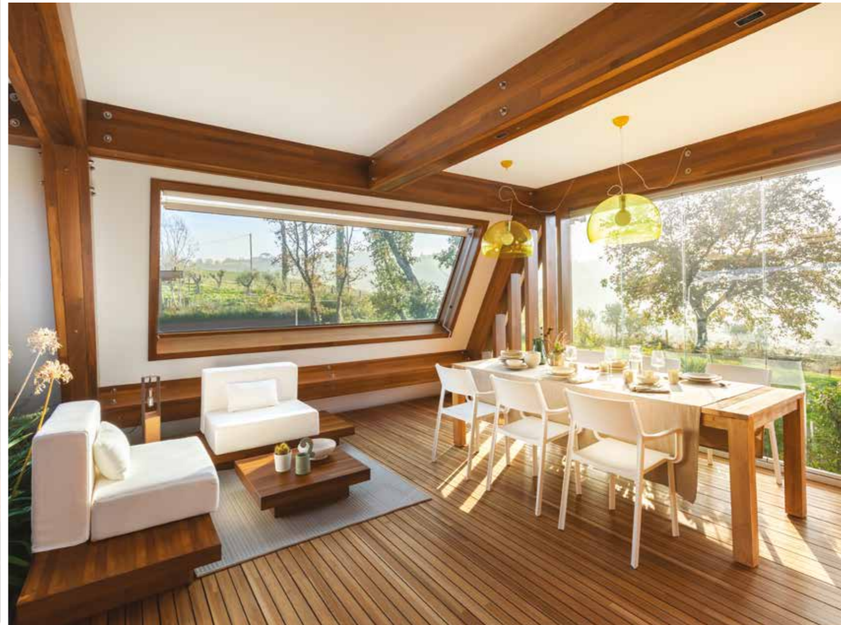
IN QUESTE PAGINE, LA SALA DA PRANZO ESTERNA COLLEGATA ALLA CUCINA. LUCI A SOSPENSIONE DI KARTELL. ON THESE PAGES: THE OUTDOOR EATING AREA CONNECTED TO THE KITCHEN. THE PENDANT LIGHTS ARE MADE BY KARTELL.