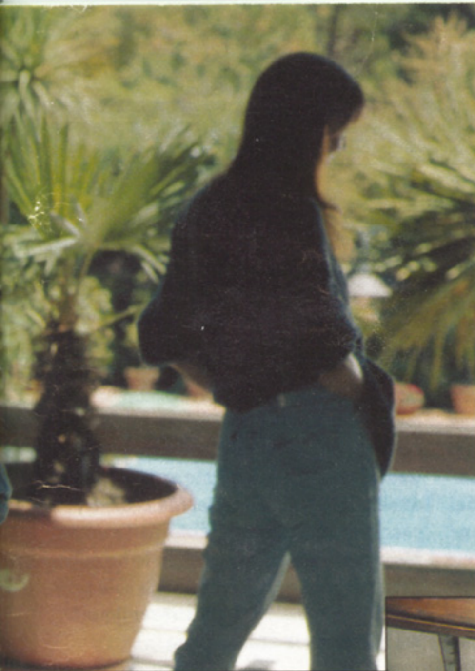
Clarissa Burt riflessa nella sua vetrata del salone, circondata di piante